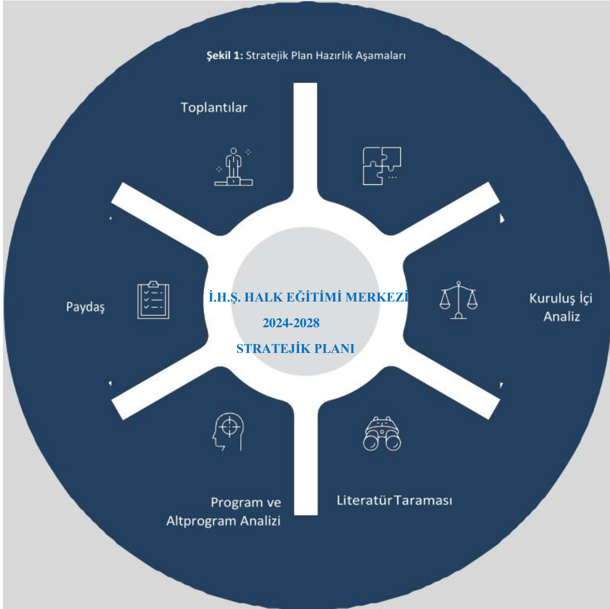
Şekil 1: Stratejik Plan Hazırlık Aşamaları

performanslarını önceden belirlenmiş olan göstergeler doğrultusunda ölçmek ve bu sürecin izleme ve değerlendirmesini yapmak amacıyla katılımcı yöntemlerle stratejik plan hazırlamaktadır.