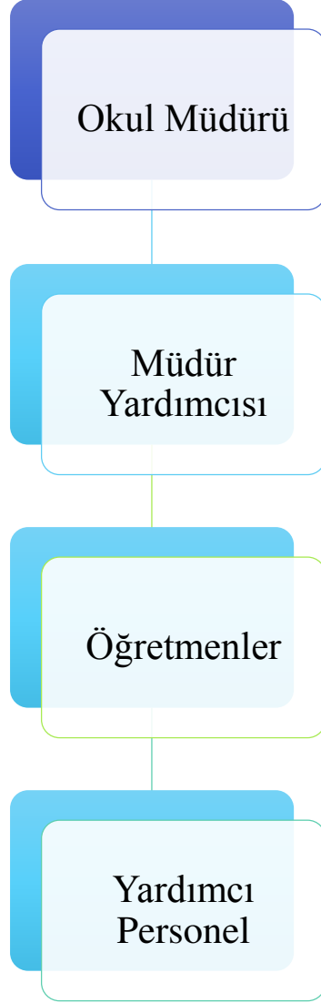
Şekil 6: İsmail Hakkı Şenpamukçu Halk Eğitimi Merkezi Teşkilat Şeması

Okul/kurumun teşkilat şeması, şubeler, bölümler, birimler, atölye/işlik durumu, sınıflar vb. ortaya konulur. Bu birimler arasında iletişimin (haberleşme, bilgi alış-verişi) nasıl sağlandığı belirtilir.